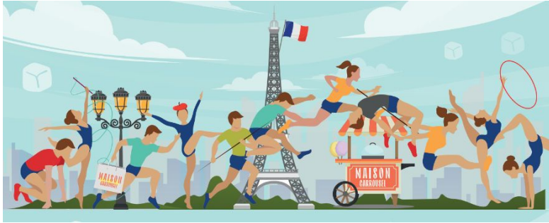
Packaging JO 2024